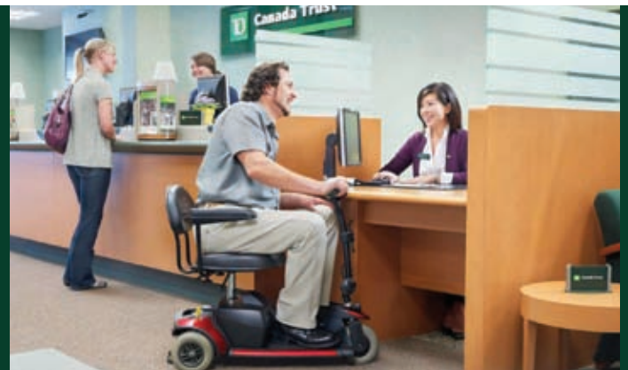
Nous faisons en sorte que la gamme complète des produits et services de la TD soit accessible à tous nos clients.