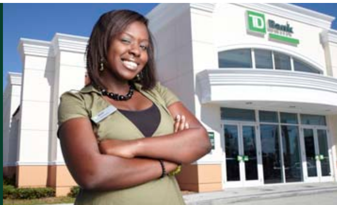
La TD exploite plus de 2 400 succursales au Canada et aux États-Unis.